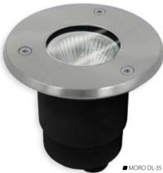
■ MORO DL-35