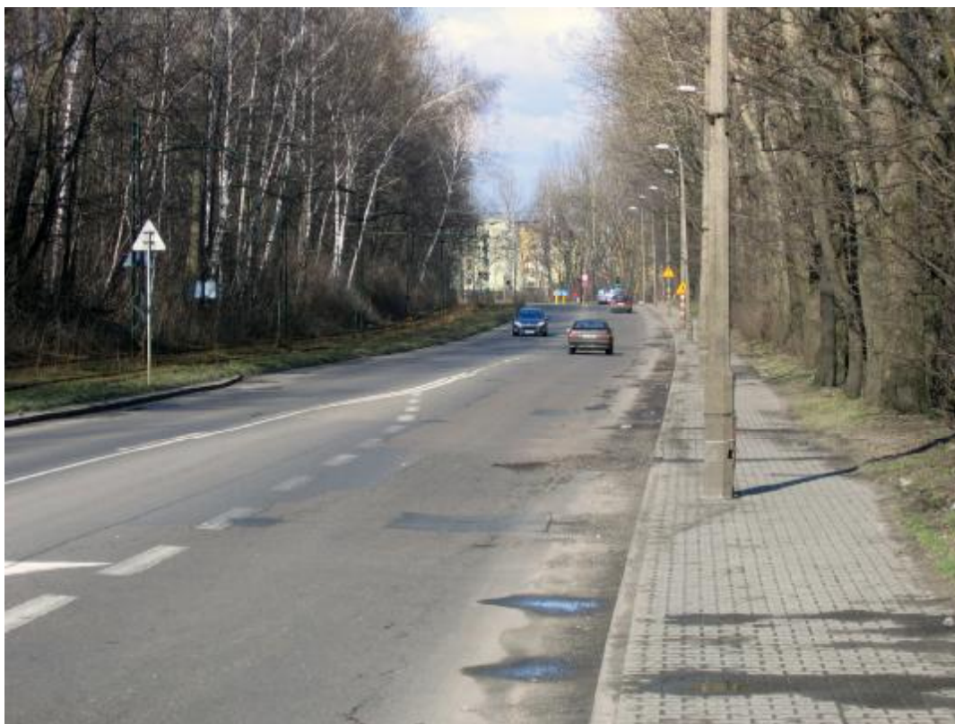
Zdj.4 i 5 Ul. Bytomska w rejonie skrzyżowania z ul. Stawową