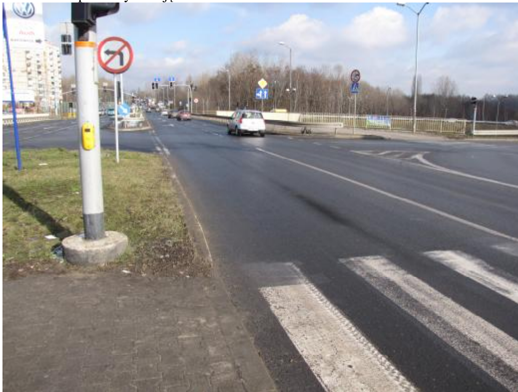
Zdj.1 Ul. Bytomska na węzle DTŚ

Typowe istniejące zagospodarowanie pasa drogowego poszczególnych odcinków ulicy przedstawiono na poniższych zdjęciach.