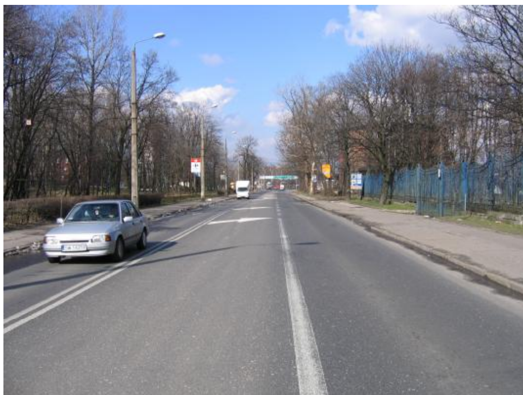
Zdj.2 i 3 Ul. Bytomska pomiędzy skrzyżowaniami z ul. Krasickiego i ul. Chorzowską