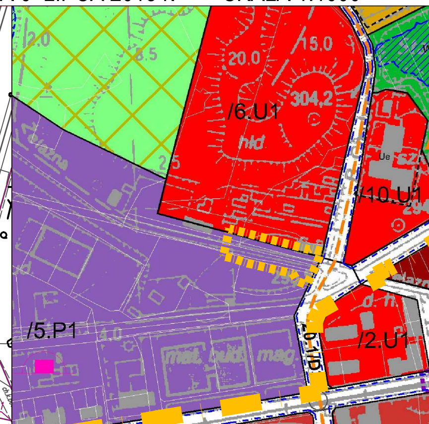
WYRYS ZE STUDYUM UWARUNKOWAŃ I KIERUNKÓW ZAGOSPODAROWANIA PRZESTRZENNEGO MIASTA ŚWIĘTOCHŁOWICE