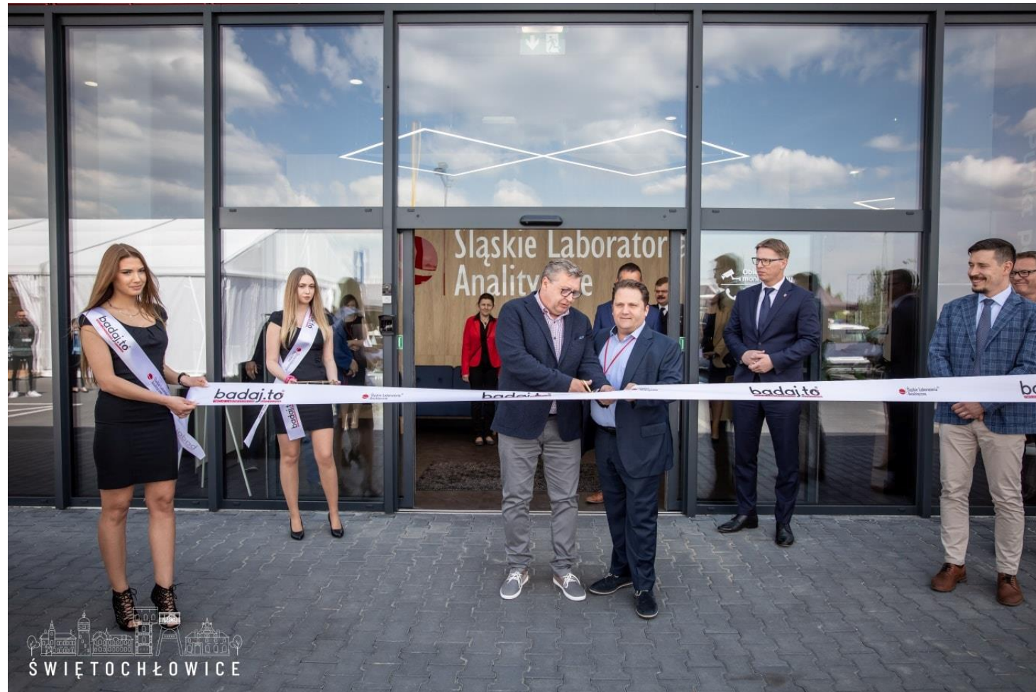
Udział w uroczystym otwarciu nowej siedziby firmy Śląskie Laboratoria Analityczne „Badaj.to”