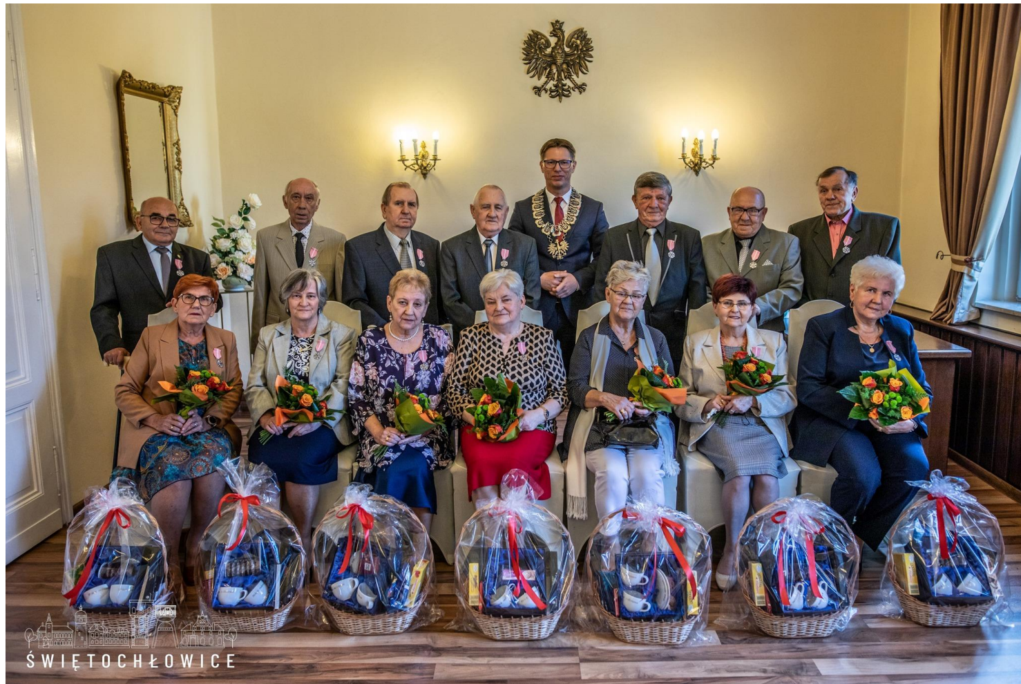
Wręczenie odznaczeń dla par świętujących 50. rocznicę ślubu