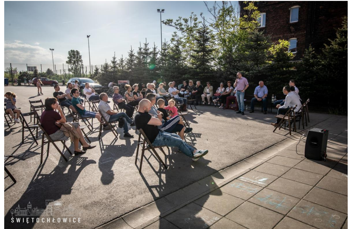
Spotkania prezydenta z mieszkańcami dzielnic: Lipiny, Chropaczów, Piaśniki i Centrum