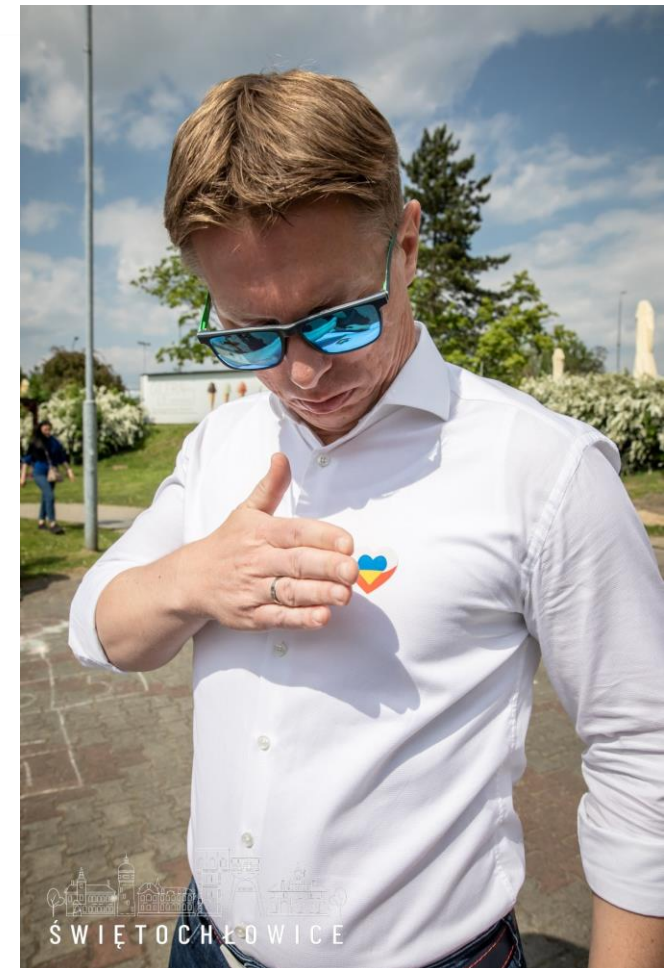
Udział w pikniku rodzinnym „Ukraina w moim sercu”,