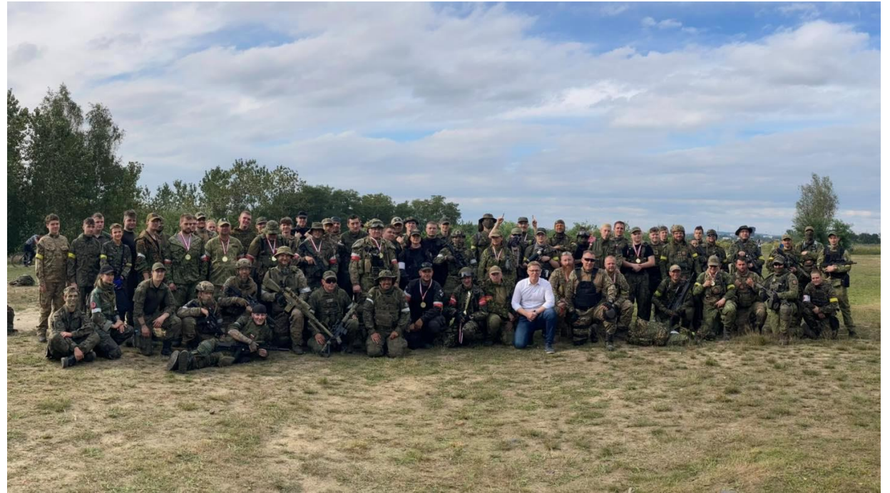
Udział w 4 Śląskich Manewrach ASG oraz Rodzinnym Pikniku Militarnym