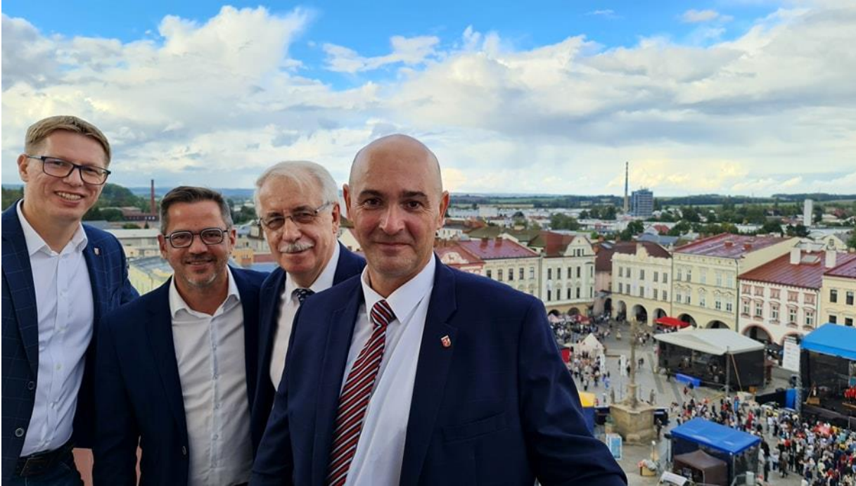
Wyjazd do Miasta Partnerskiego Świętochłowic i udział w Dniach Miasta Novy Jicin