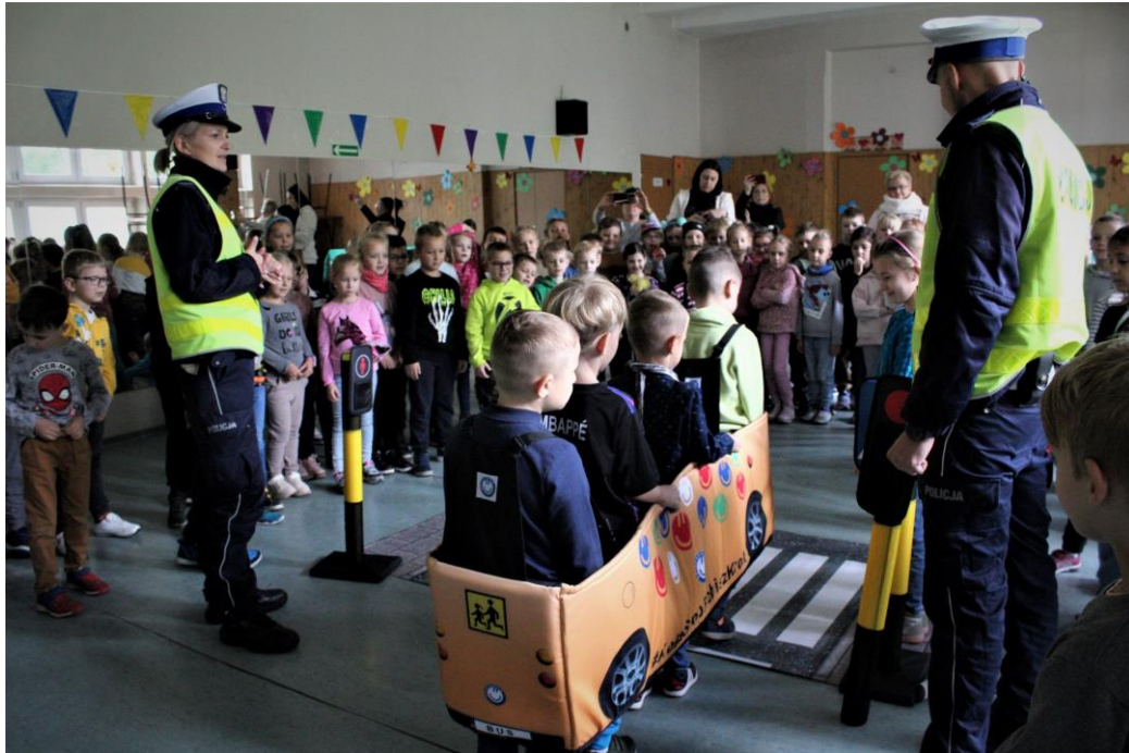
Udział w akcji „Bezpieczna droga do szkoły”