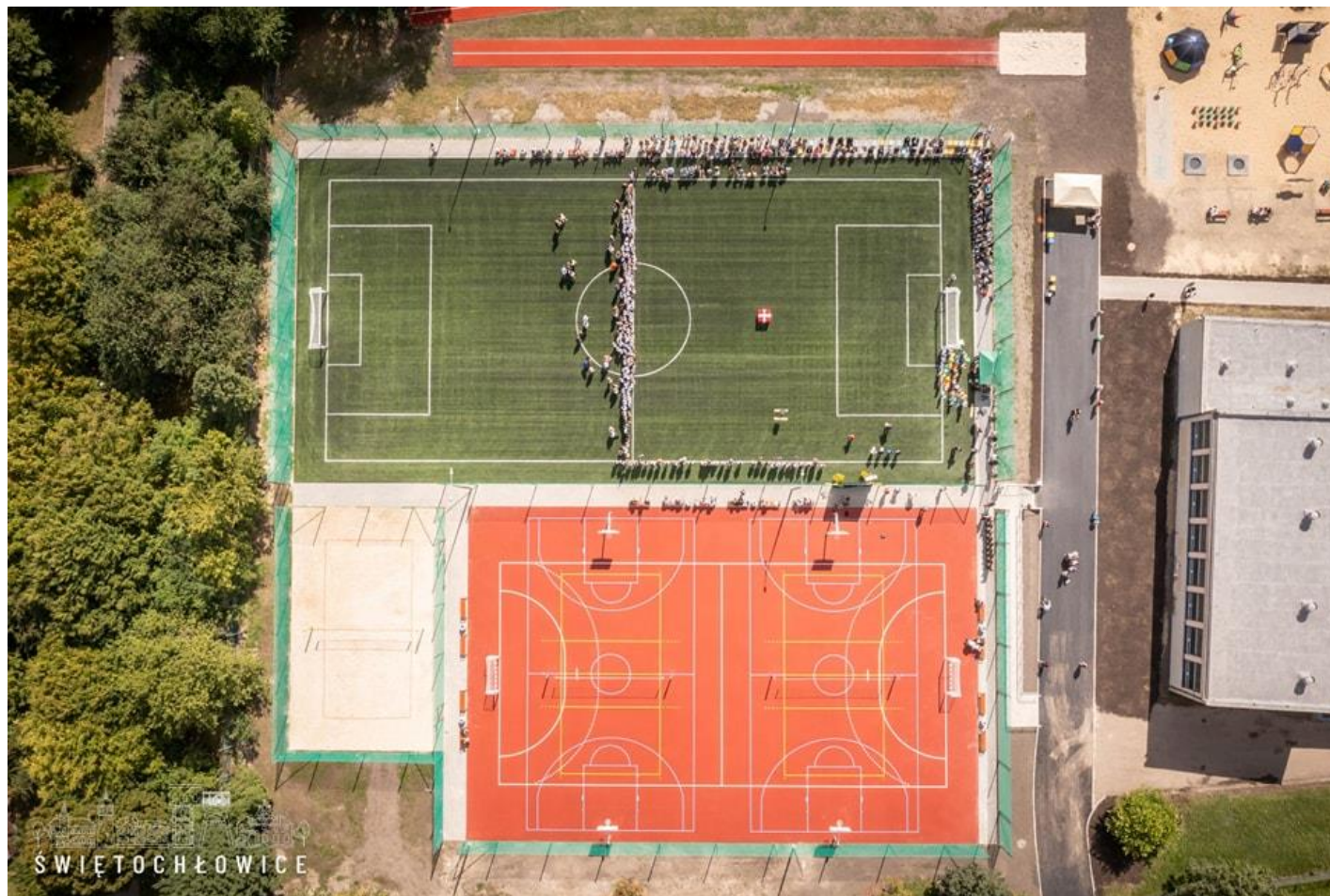
Uroczyste otwarcie kompleksu boisk przy ZSO