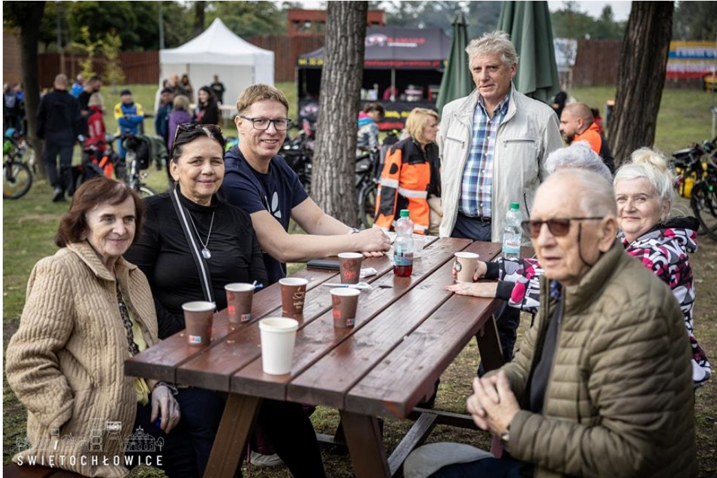
Udział w Pikniku Organizacji Pozarządowych