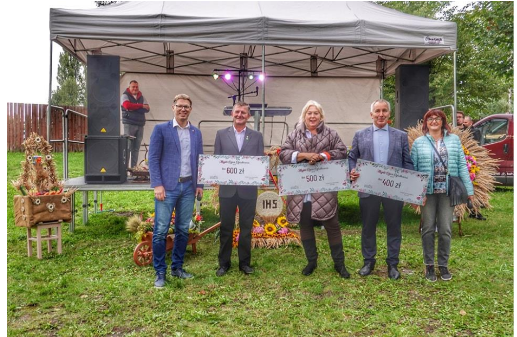
Udział w Miejskim Dniu Działkowca