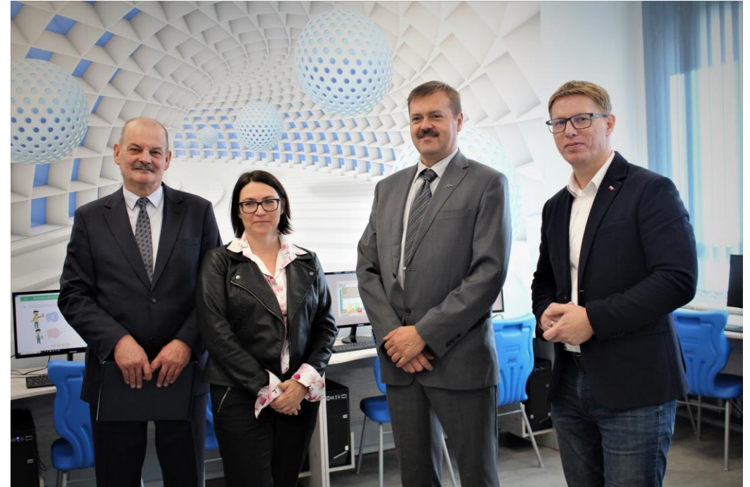
Otwarcie nowoczesnej pracowni komputerowej w SPS 10