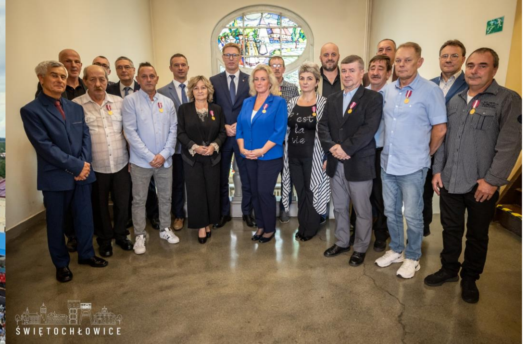
Wręczenie pracownikom MPGL Złotych Medalii Prezydenta Andrzeja Dudy