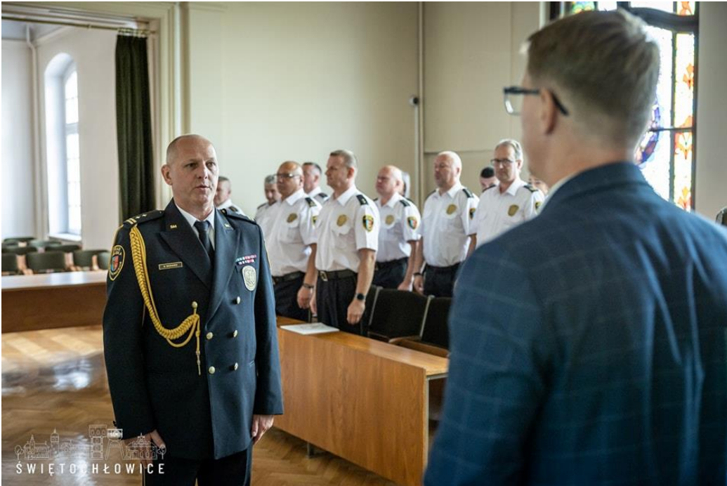
Wręczenie wyróżnień i awansów w ramach Święta Straży Miejskiej