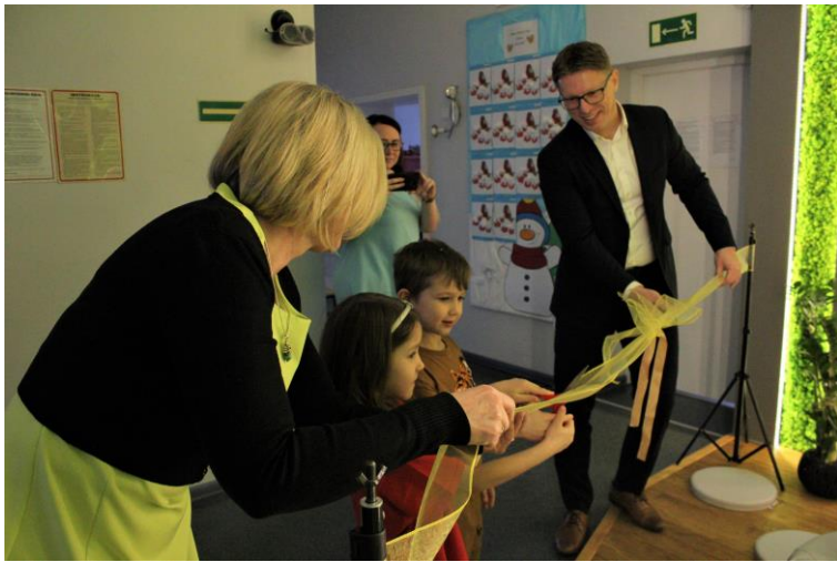
Otwarcie mini-ogrodu w Przedszkolu Miejskim nr 4