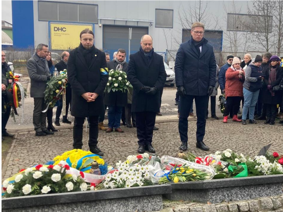
Udział w uroczystościach przed bramą dawnego obozu „Zgoda”, wieńczących coroczny „Marsz na Zgodę” upamiętniający ofiary Tragedii Górnośląskiej