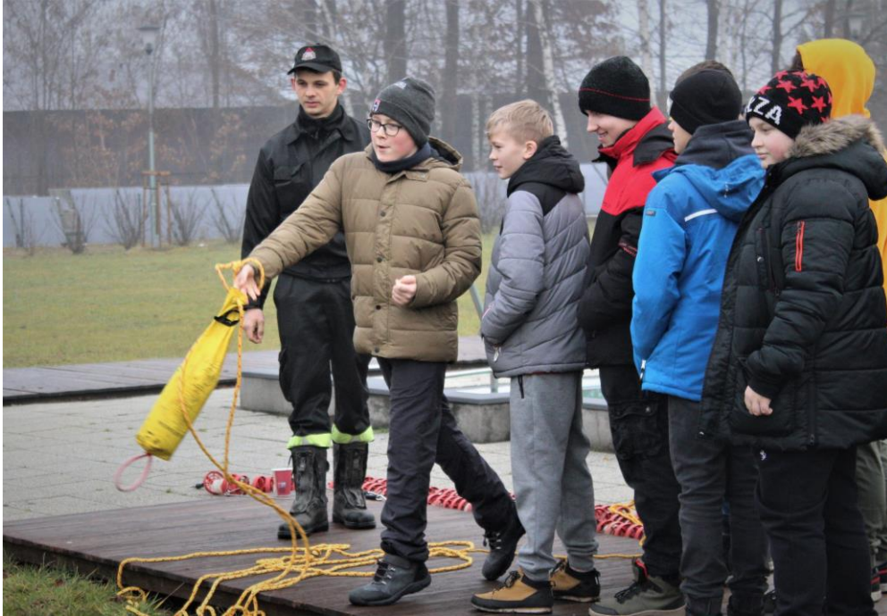
Akcja „Bezpieczne Ferie”