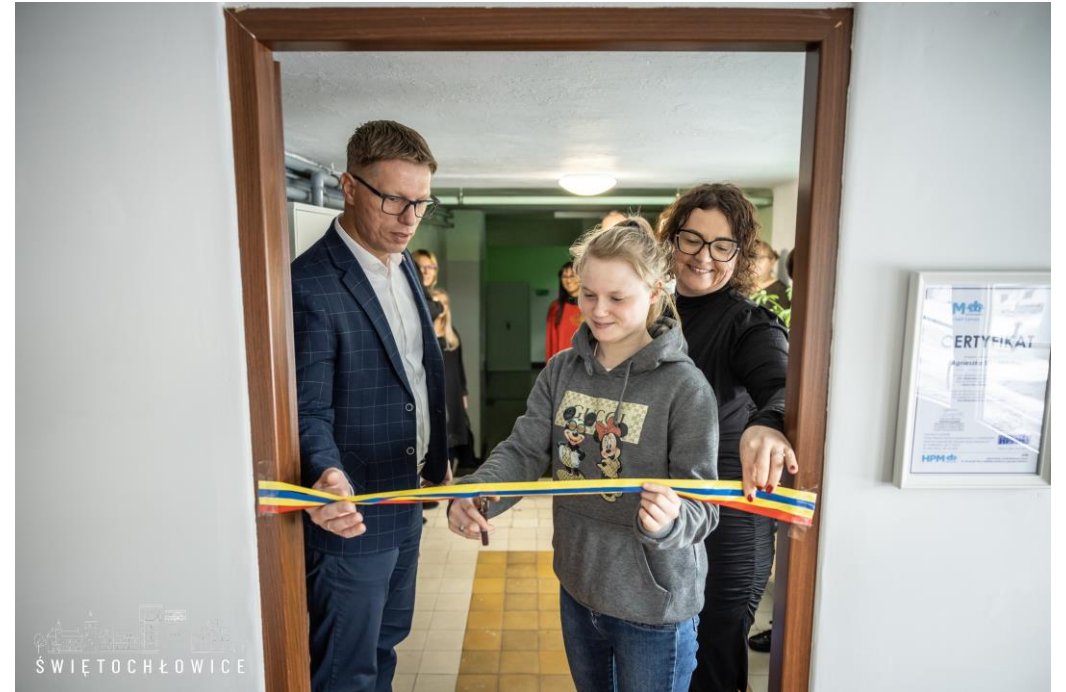
Otwarcie Gabinetu terapii EEG w Zespole Edukacji Wspomagającej