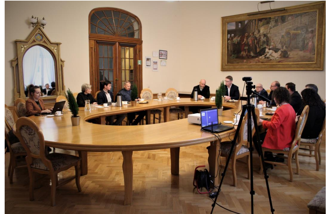
Spotkanie w sprawie „Obozu Zgoda” z przedstawicielami komitetu społecznego budowy pomnika oraz środowiskami zaangażowanymi w proces upamiętnienia ofiar