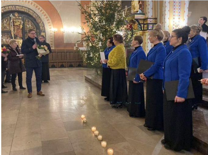
Jubileusz 25-lecia Chóru Magnificat