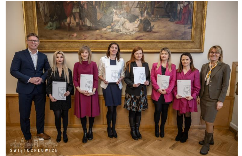
Wręczenie aktów mianowania dla nauczycieli