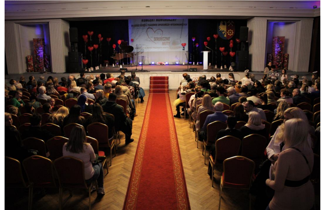
Noworoczny Charytatywny Koncert „Serdeczne Nuty”