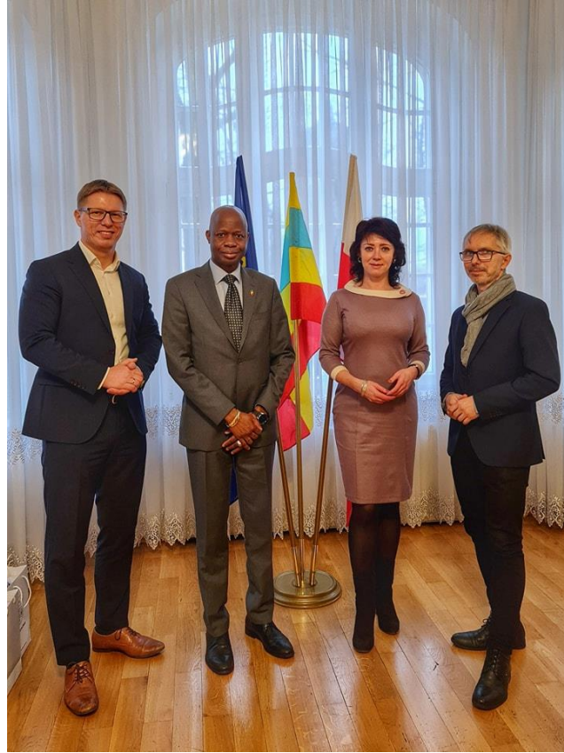
Wizyta konsula z Mali