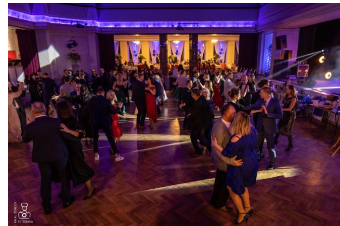
II Charytatywny Bal Prezydenta Miasta