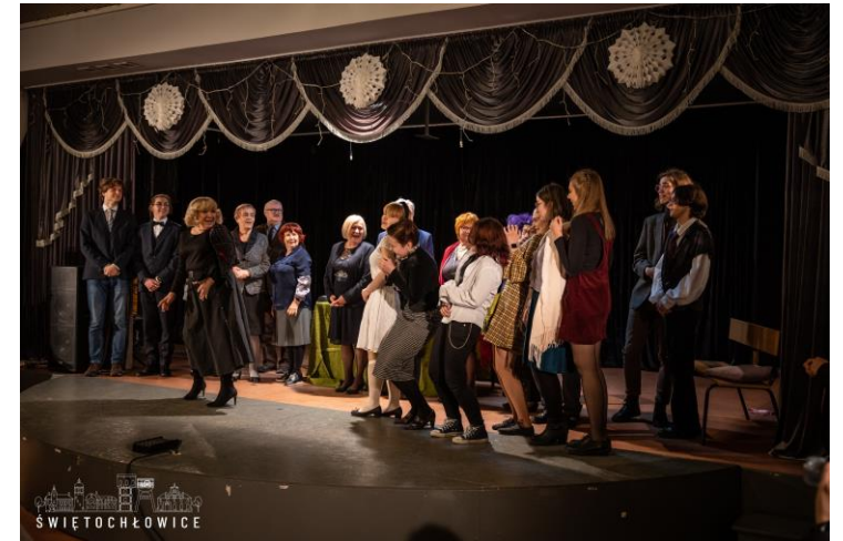
Spektakl przygotowany przez teatr Uniwersytetu Trzeciego Wieku wraz z młodzieżą z Salezjańskiego Zespołu Szkół Publicznych „Don Bosko”