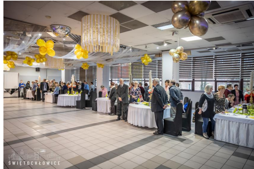
35-lecie Oddziału PTTK Świętochłowice