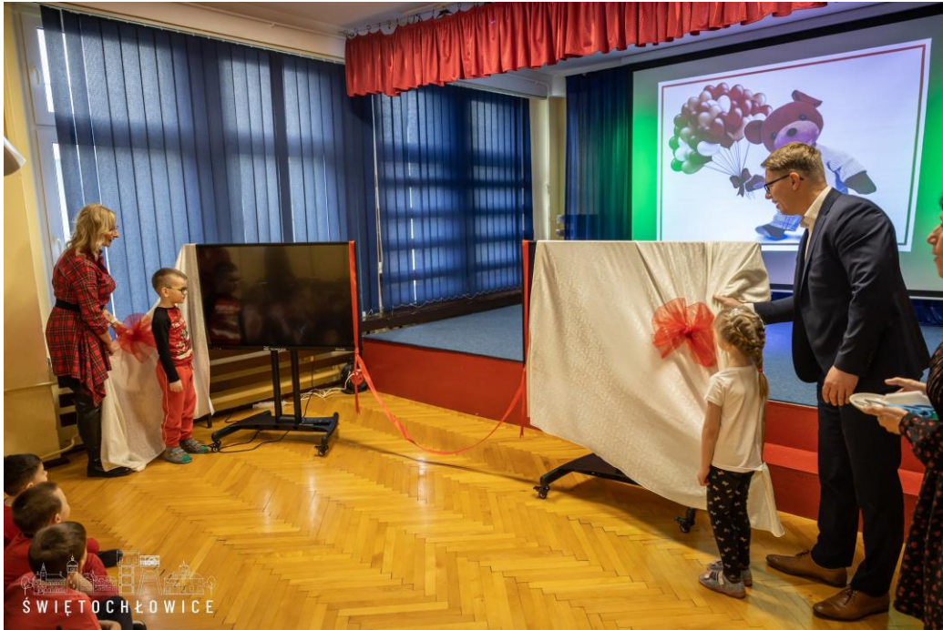
Prezentacja ekranów multimedialnych wygranych przez PM nr 13 im. Misia Uszatka w Świętochłowicach w konkursie "Plakaty promujące segregację śmieci"