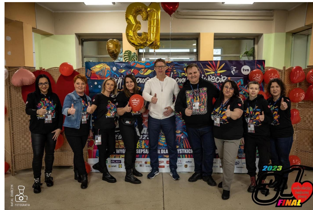
Finał Wielkiej Orkiestry Świątecznej Pomocy