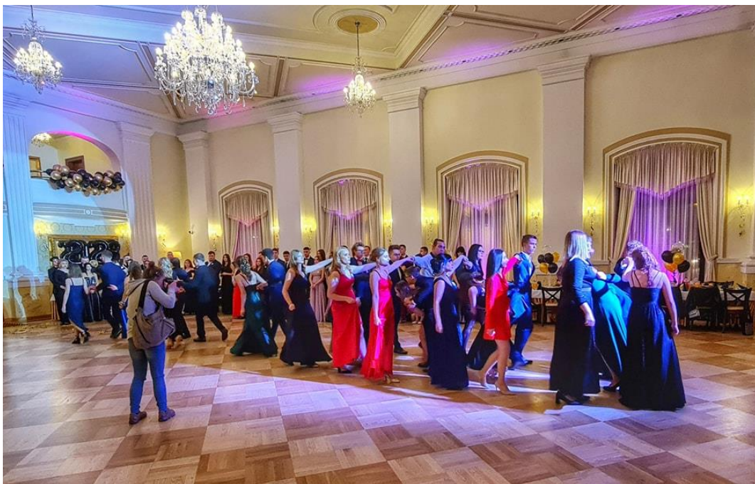
Studniówki klas maturalnych