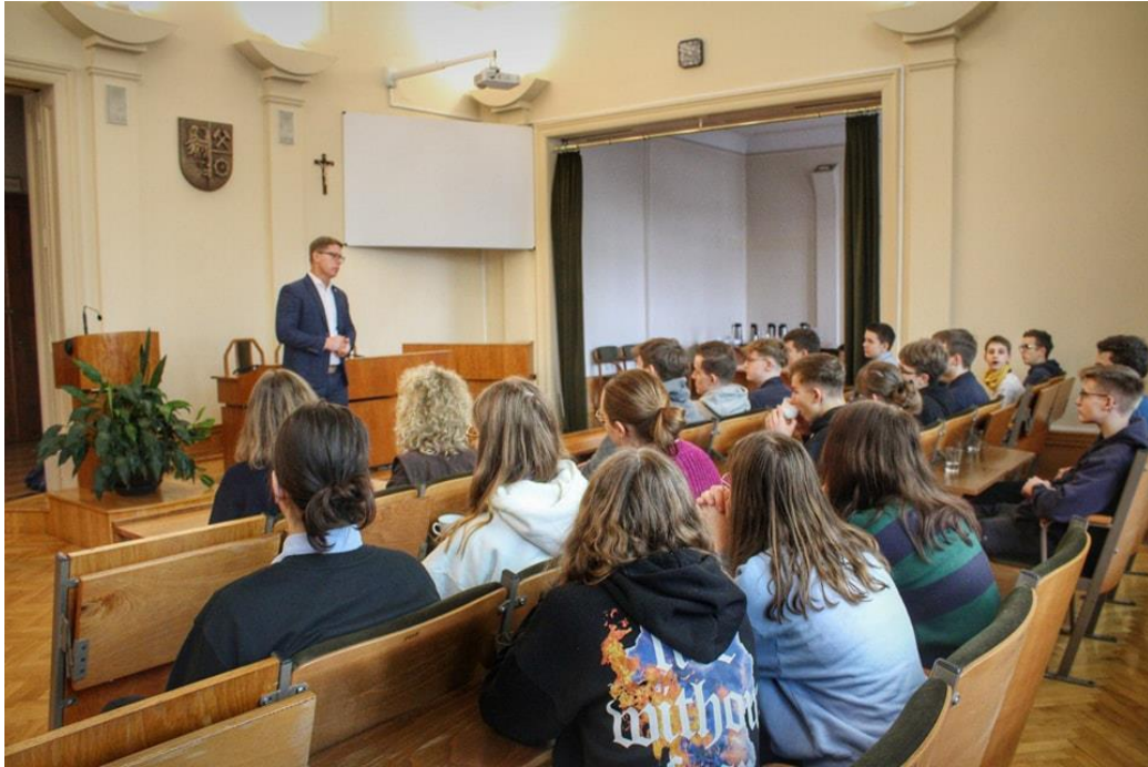
Wizyta młodzieży dwóch szkół: Salezjański Zespół Szkół „Don Bosko” oraz Peter-Wust- Gymnasium Wittlich w ramach wymiany niemiecko-polskiej