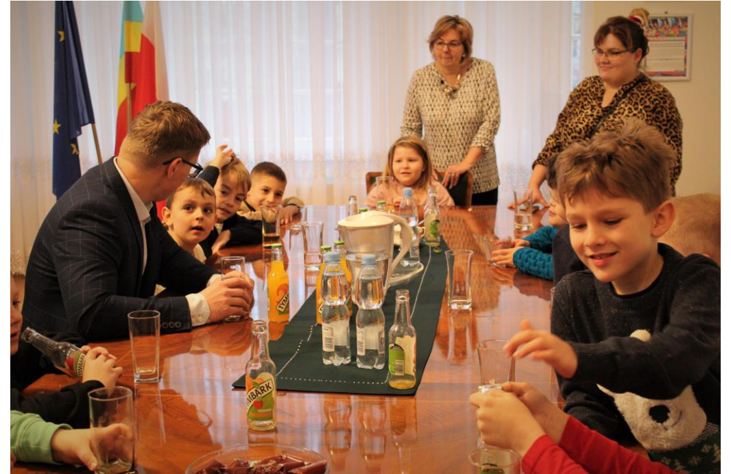
Wizyty uczniów szkół podstawowych w Urzędzie Miejskim