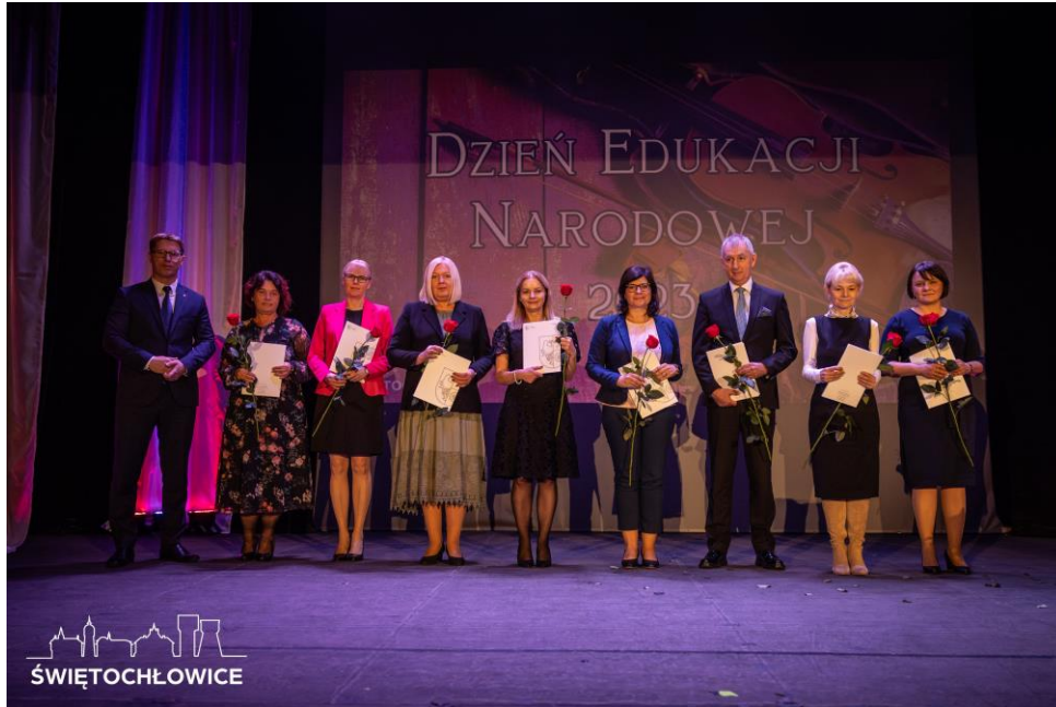
Dzień Edukacji Narodowej w Centrum Kultury Śląskiej