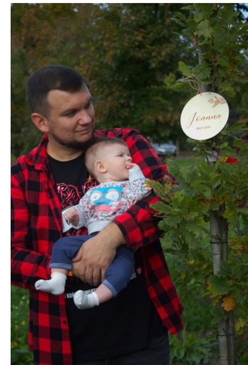
Akcja drzewko za dziecko