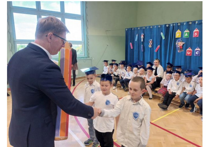
Pasowanie na ucznia w Szkole Podstawowej nr 17