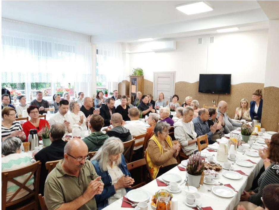
Światowy Dzień Zdrowia Psychicznego w ŚDS