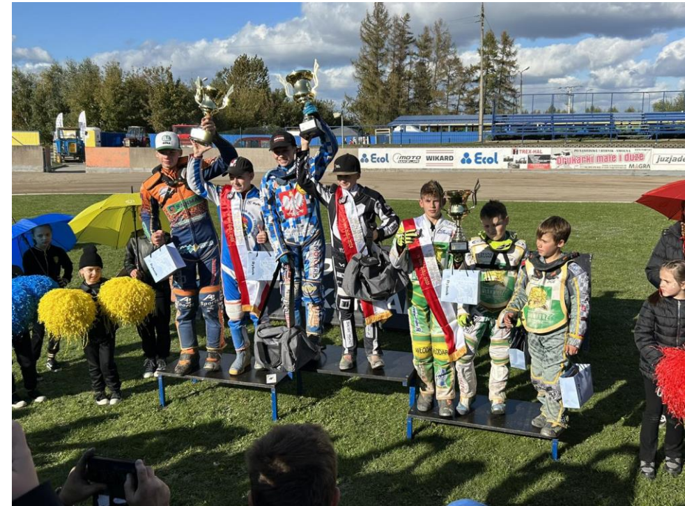
Finał Mistrzostw Polski Par Klubowych w Rybniku