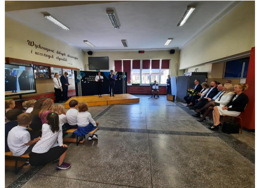
Dzień Edukacji Narodowej w Salezjańskim Zespole Szkół Publicznych „Don Bosko”