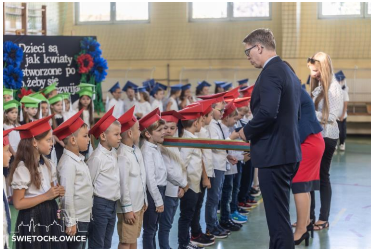
Pasowanie na ucznia w Szkole Podstawowej nr 1