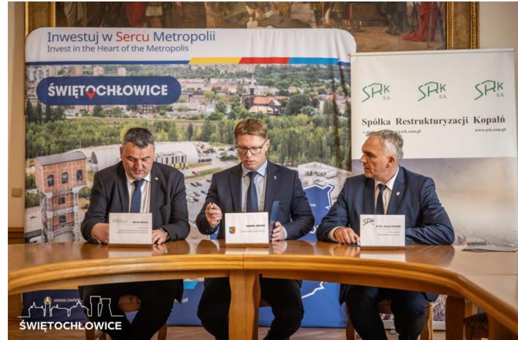
Podpisanie listu intencyjnego pomiędzy Miastem Świętochłowice, a Spółką Restrukturyzacji Kopalń S.A