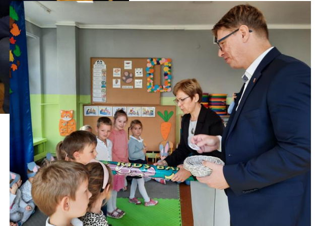
Pasowanie na ucznia w Szkole Podstawowej nr 4 oraz otwarcie wyremontowanego placu