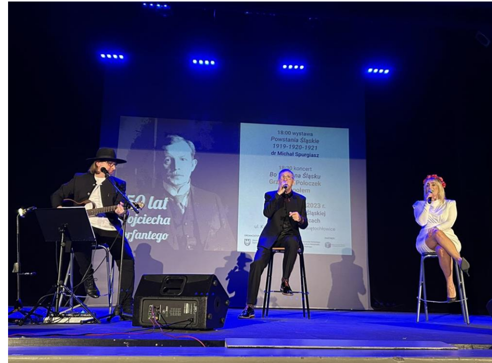
Trwa Rok Korfantego