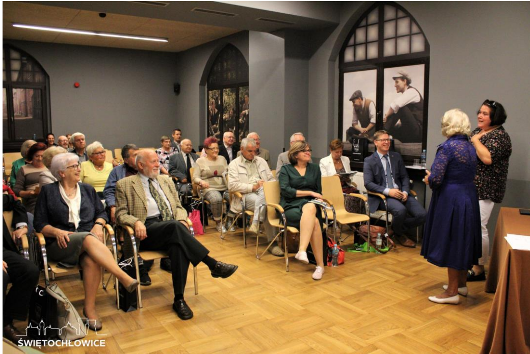
Srebrna Konferencja – spotkanie przedstawicieli Rad Seniorów