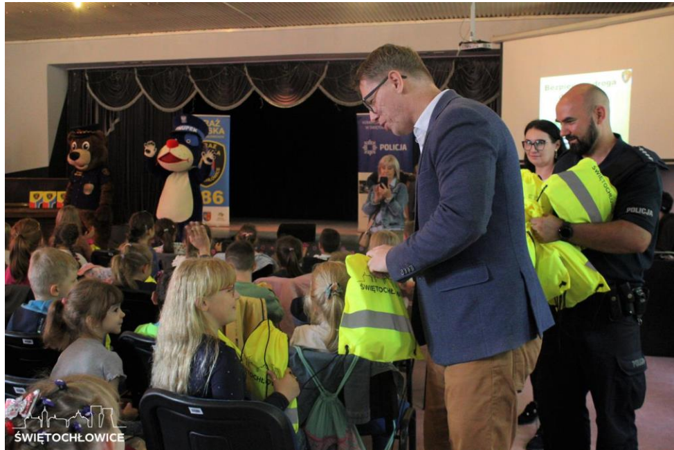
Akcja „Bezpieczna droga do szkoły”