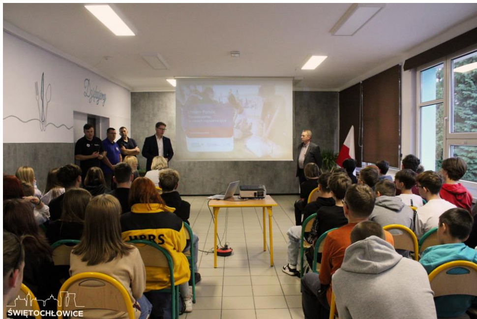
Akcja „Umiem Pomóc” w Szkole Podstawowej nr 8