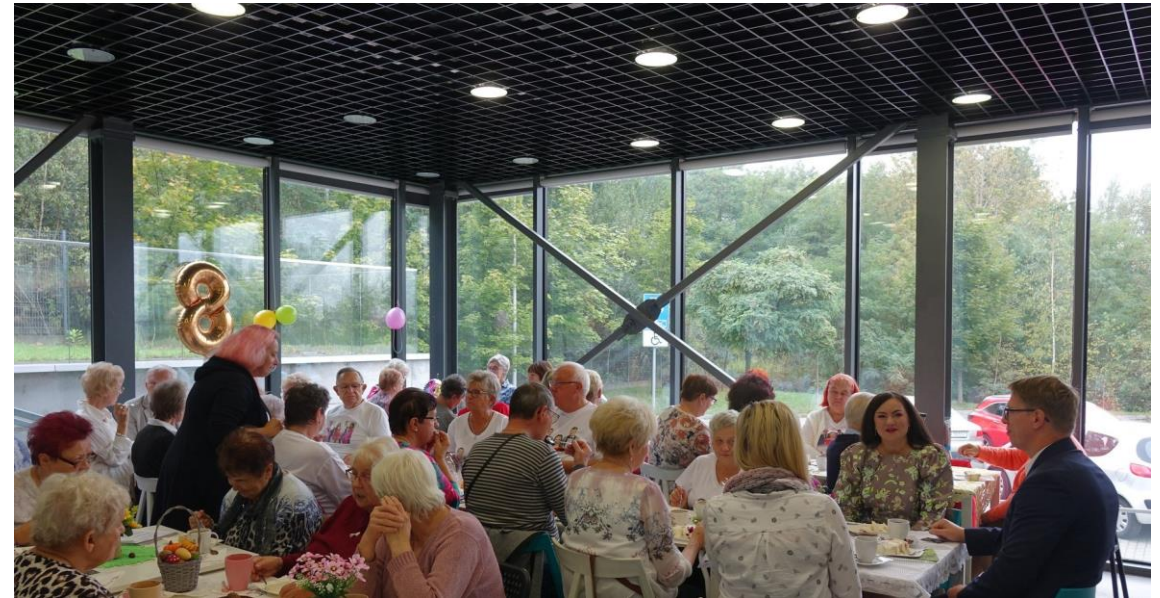
Inauguracja roku akademickiego Uniwersytetu Trzeciego Wieku w Centrum Kultury Śląskiej