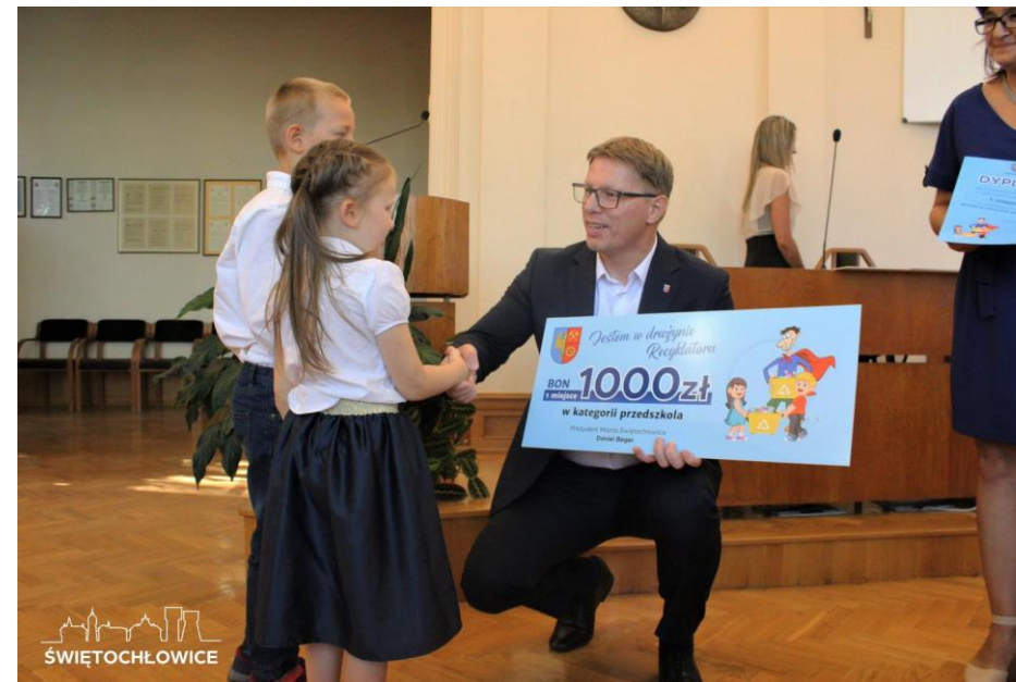
Akcja „Jestem w drużynie Recyklatora”