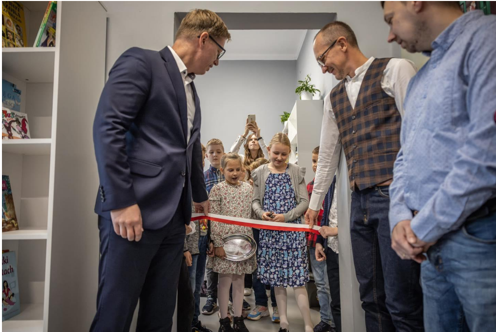
Otwarcie wyremontowanej biblioteki, otwarcie chillroomu oraz nowego miejsca spotkań samorządu w Szkole Podstawowej nr 2