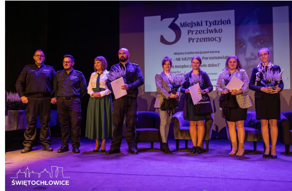
Gala w ramach III Miejskiego Tygodnia Przeciwko Przemocy