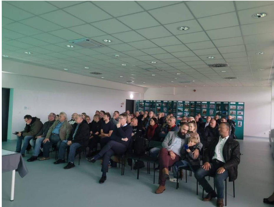
Konsultacje społeczne dotyczące rewitalizacji Parku Jordanowskiego