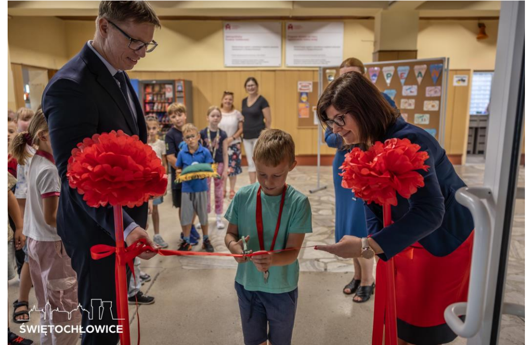
Otwarcie wyremontowanej stołówki, biblioteczki oraz sekretariatu z gabinetem dyrektora w Szkole Podstawowej nr 1