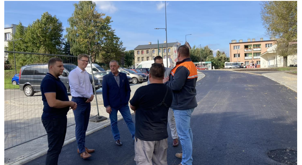
Zakończenie remontu drogi – ul. Szczytowa