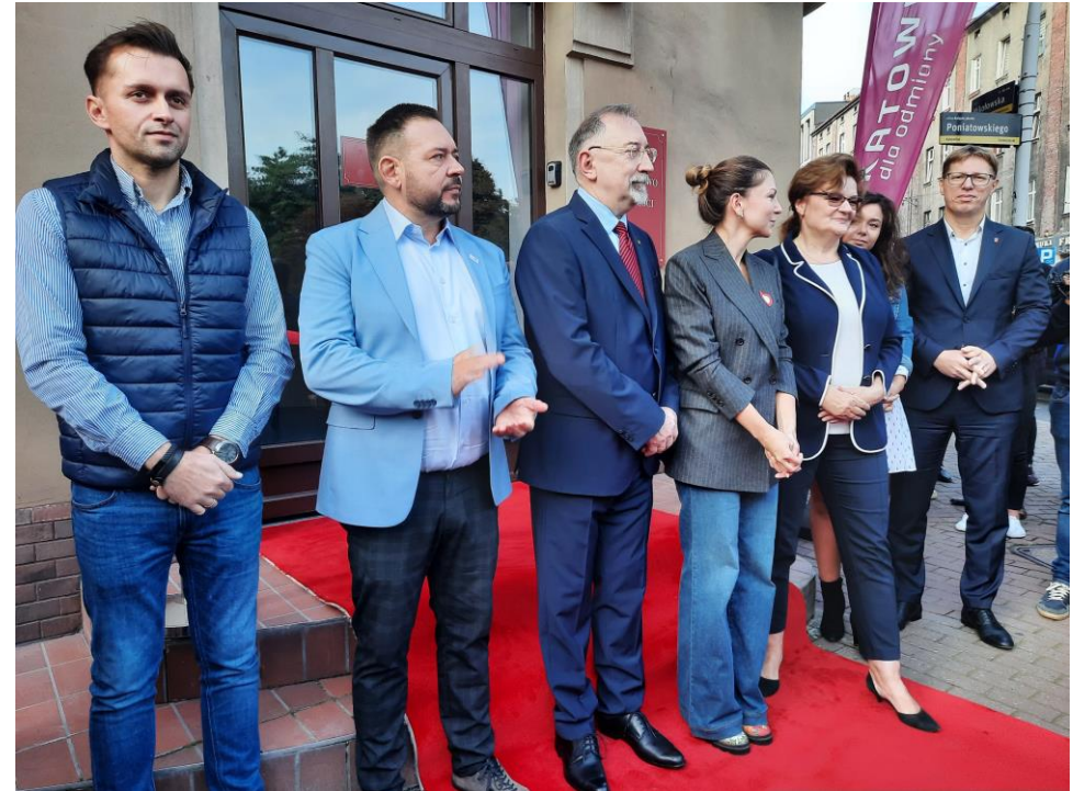
Udział w otwarciu Społecznego Ministerstwa ds. Samotności w Katowicach