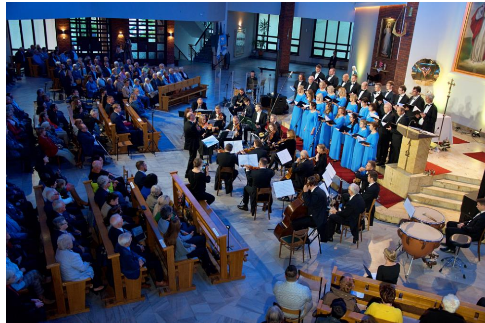
30 – lecie istnienia chóru EX Animo