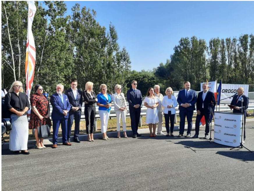
Udział w otwarciu odcinka trasy N-S w Rudzie Śląskiej