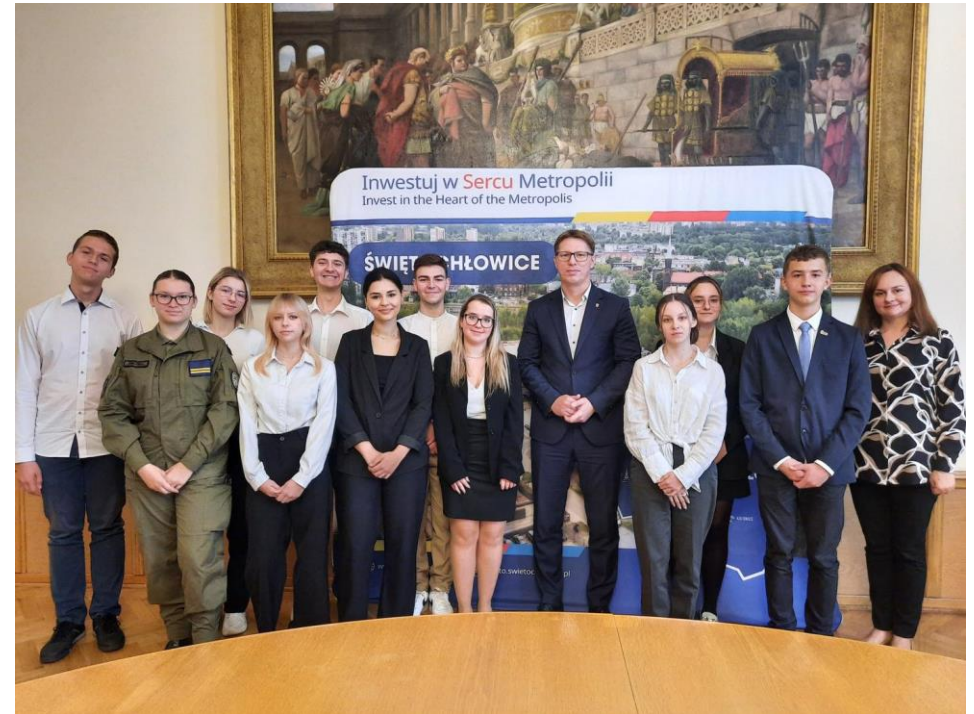
Ślubowanie nowych członków Młodzieżowej Rady Miejskiej w Świętochłowicach – uzupełnienie składu Rady