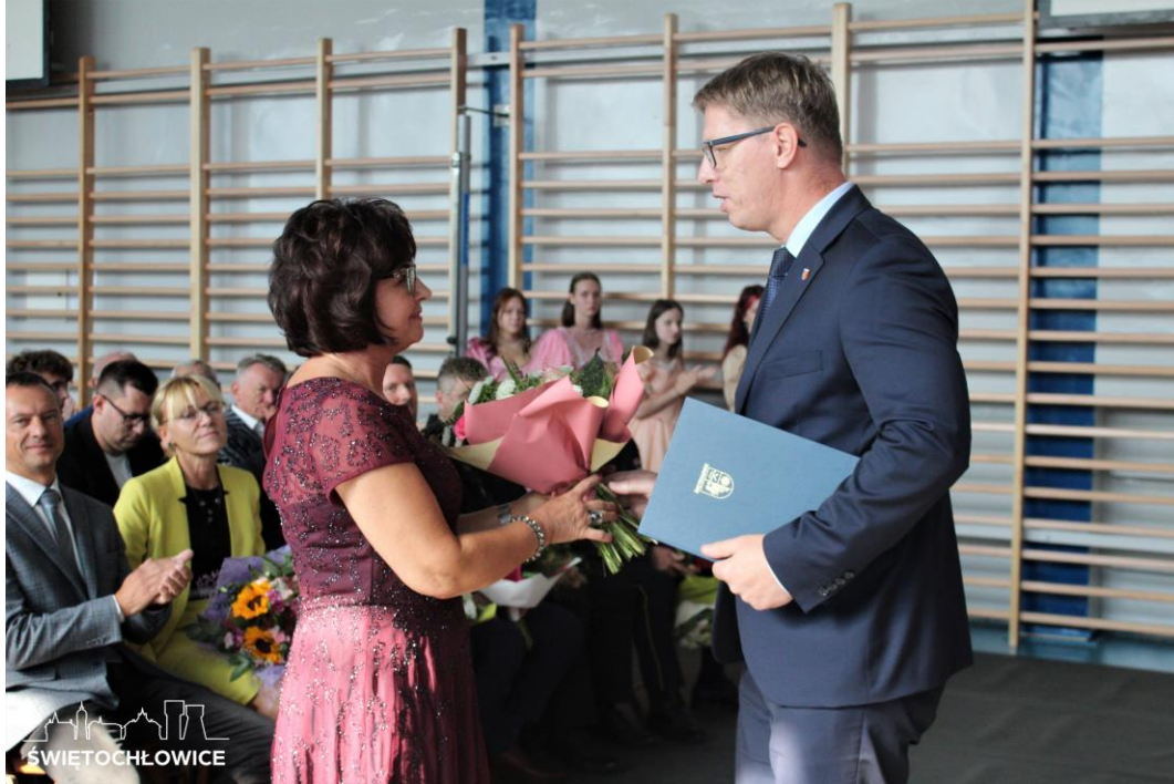
75-lecie I LO z Oddziałami Dwujęzycznymi im. J. Kochanowskiego