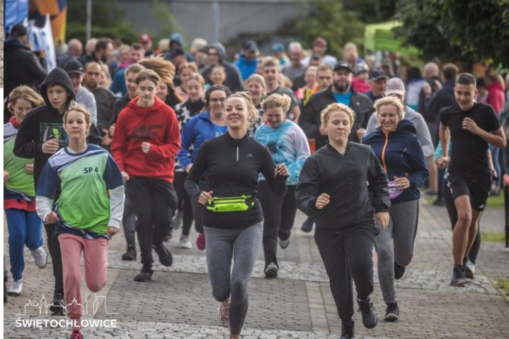
Bieg rekreacyjny z okazji III Miejskiego Tygodnia Przeciwno Przemocy