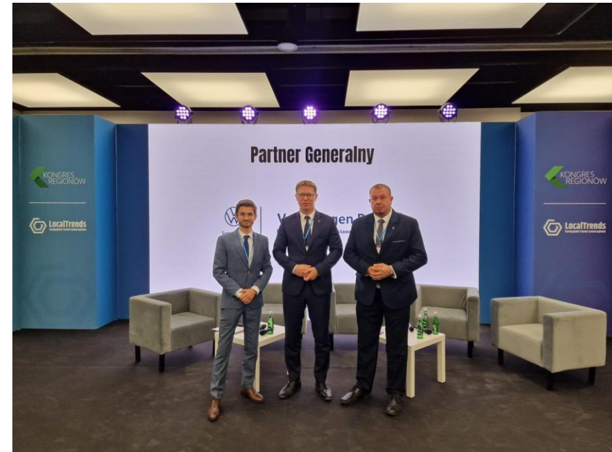
Debata Localtrends w Poznaniu