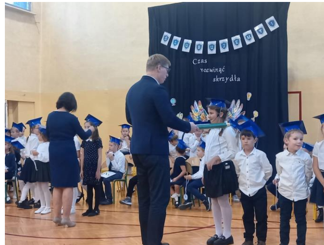
Pasowanie na ucznia w Szkole Podstawowej nr 5